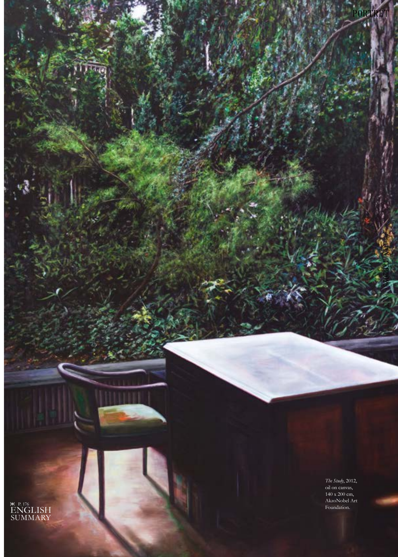
The Study , 2012, oil on canvas, 140 x 200 cm, AkzoNobel Art Foundation.

'Ja, soms krijg ik ook tips van vrienden. Zo kom ik in ruimtes die verlaten zijn, lege plekken. In een lege ruimte zijn altijd nog zo veel sporen te vinden van wat er is gebeurd. De geschiedenis van zo'n plek vind ik fascinerend. Onlangs ben ik met mijn zus naar België gegaan om daar weer eens een lege villa binnen te sluipen. Dat deden we vroeger ook al. Het was een grote vervallen toestand, maar bizar wat je aantreft, dat is niet te verzinnen. Het stond bomvol met prachtige meubels, spiegels, dressoirs, karaffen, transistorradio's en fotoalbums van een familie uit de jaren dertig. Er stond zelfs een oldtimer in dat huis. Het was heel filmisch, heel intens. Ik maak dan foto's. Voor mij zijn dat visuele aantekeningen.'