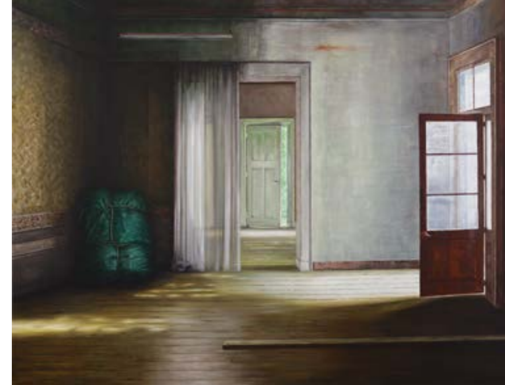
BOVEN Side Door , 2019, oil on canvas, 197 x 158 cm.