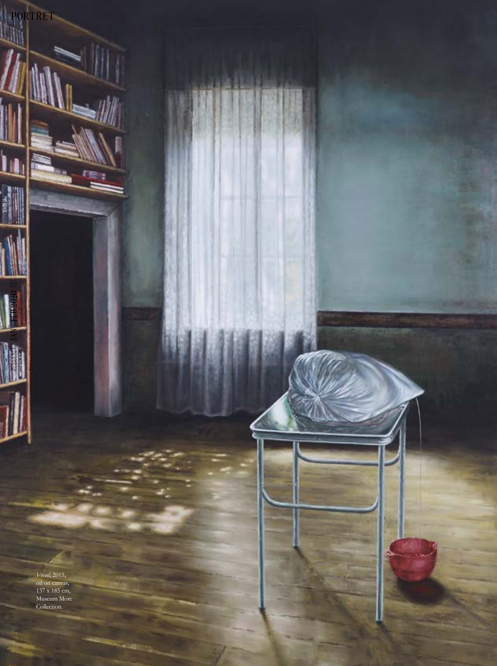
Vassel, 2015, oil on canvas, 137 x 185 cm, Museum More Collection.