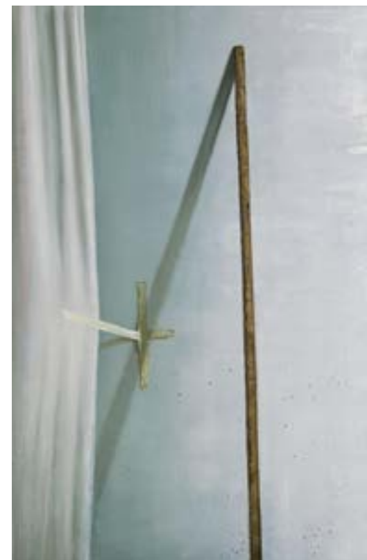
LINKS Still Point , 2016, oil on canvas, 37 x 56 cm, private collection.

Is dat een van de projecten waar je nu mee bezig bent?