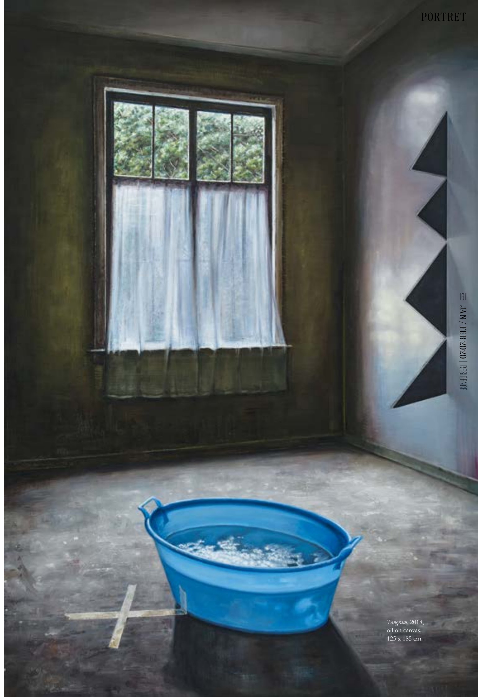
Tangram , 2018, oil on canvas, 125 x 185 cm.